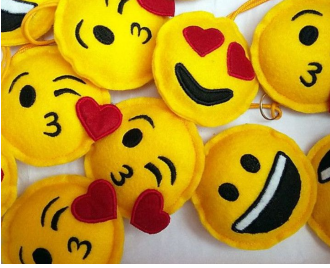
Chaveirinho de Emoji