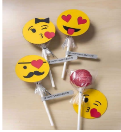
Pirulito com rostinho emoji