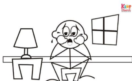
de ficar sozinho em casa

Hoje vamos falar de Josué. Será que ele teve medo? Medo de ser rejeitado pelo povo, medo de ser líder, e até medo de ficar sozinho